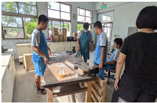
說明：成功大學 USR 合作推動