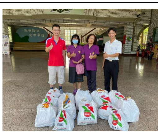
說明：九龍德門愛心急助會合作推動