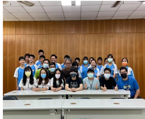
說明：台南藝術大學合作推動