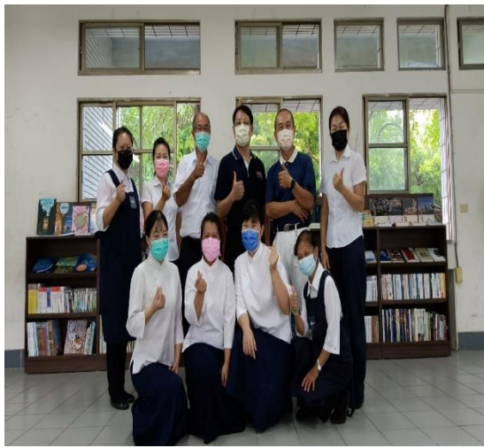
說明：慈濟功德會合作推動