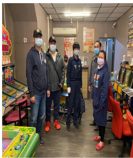
說明：派出所合作推動