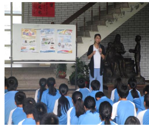
說明：衛生所登革熱防治宣導