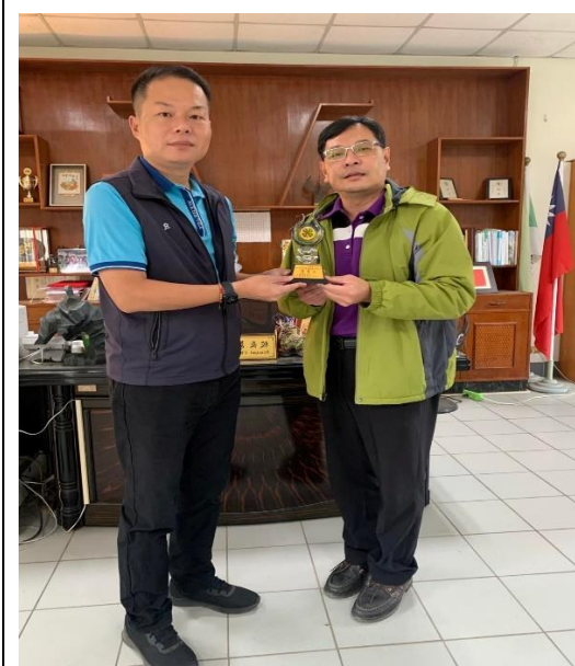
說明：官田農會合作推動