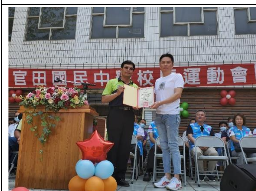
說明：福汎企業捐贈合作推動