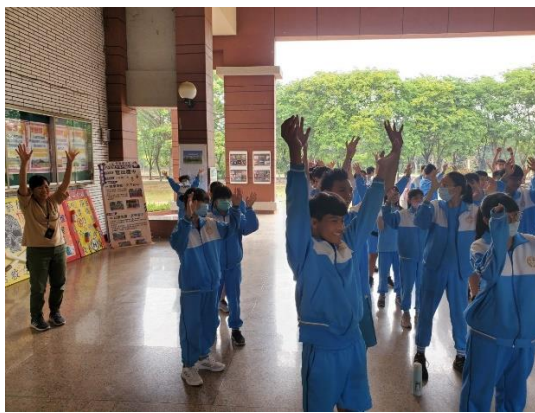
說明：麻豆新樓與官中合作推動健促