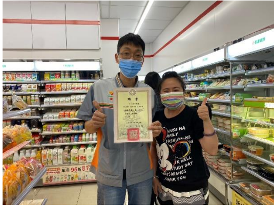
說明：7-11 與官中合作推動