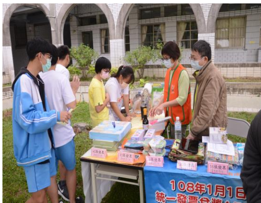
說明：運動會-稅務局擺攤宣導