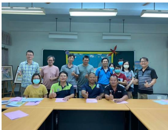
說明：家長會全力支援