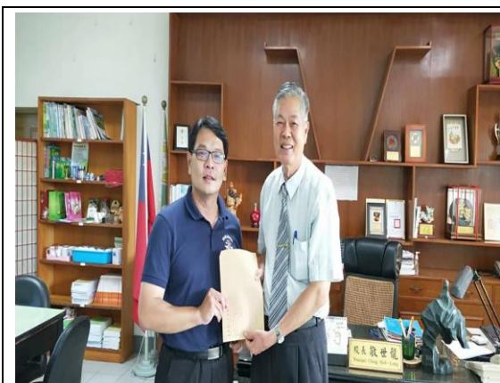
說明：社區高中伙伴學校