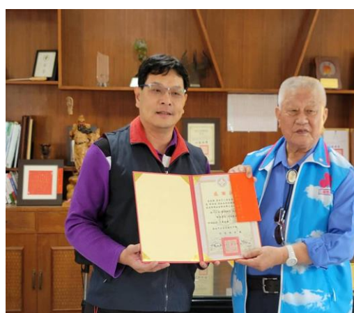
說明：三聖慈善會合作推動