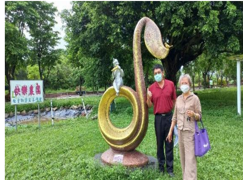
說明：賴本源文教基金會合作推動