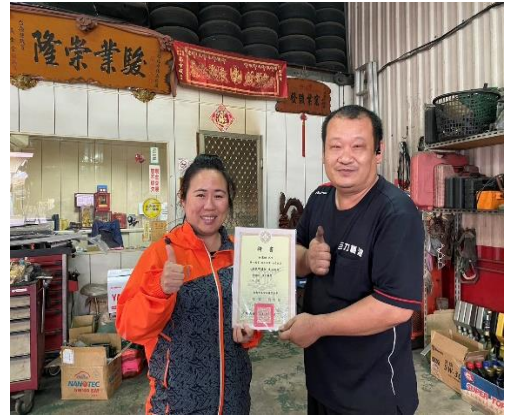
說明：在地汽修廠與官中合作