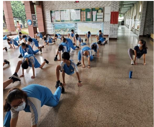
說明：衛生所推動律動