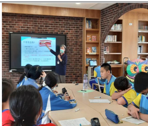
高血脂造成血管阻塞