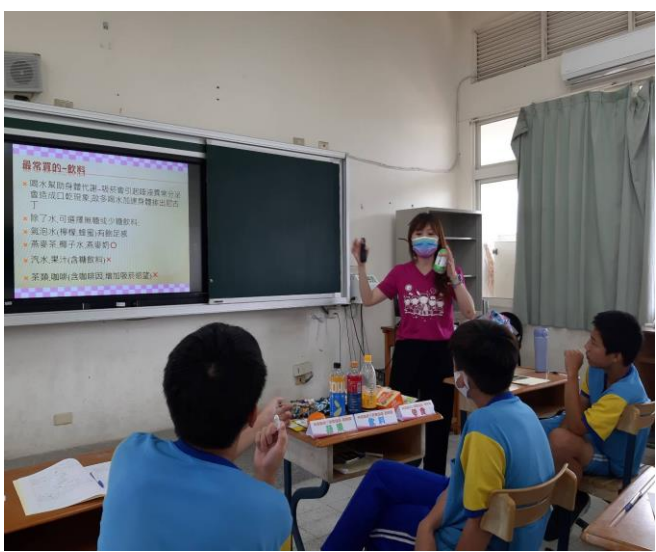
戒菸時期可食用的飲料