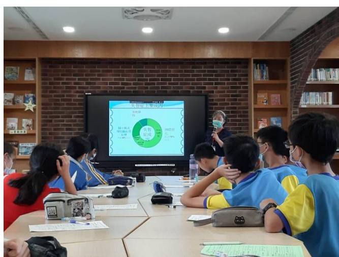
失智症的主要原因