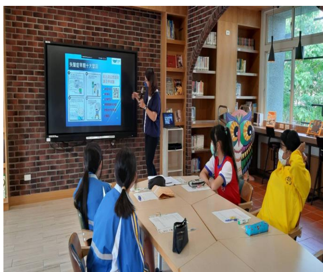
失智症早期出現的警訊