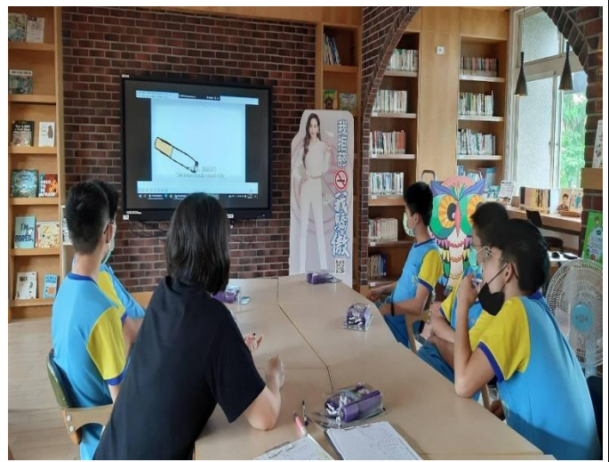
觀賞菸害防制的影片