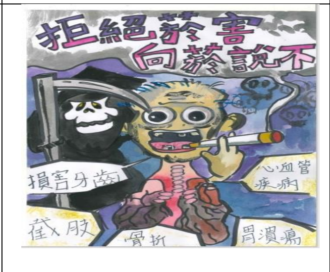
菸癮防制創意標語優秀作品