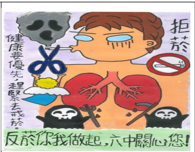
菸癮防制創意標語優秀作品