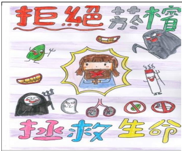
菸癮防制創意標語優秀作品