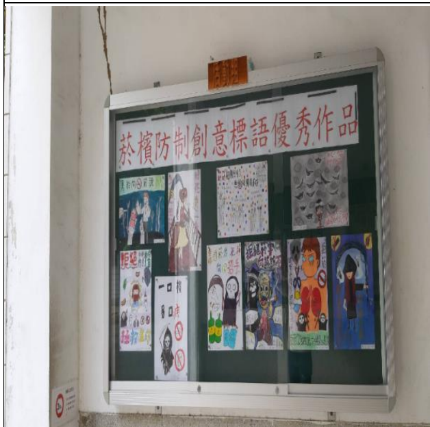
優秀作品美化校園佈告欄