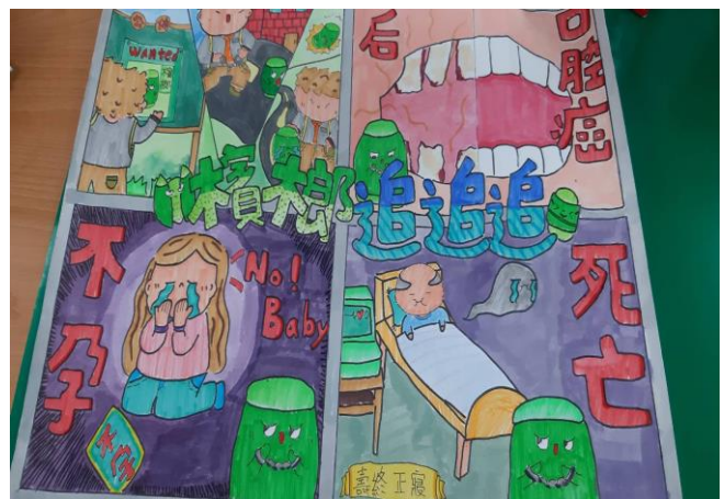
菸檳防制四格漫畫作品