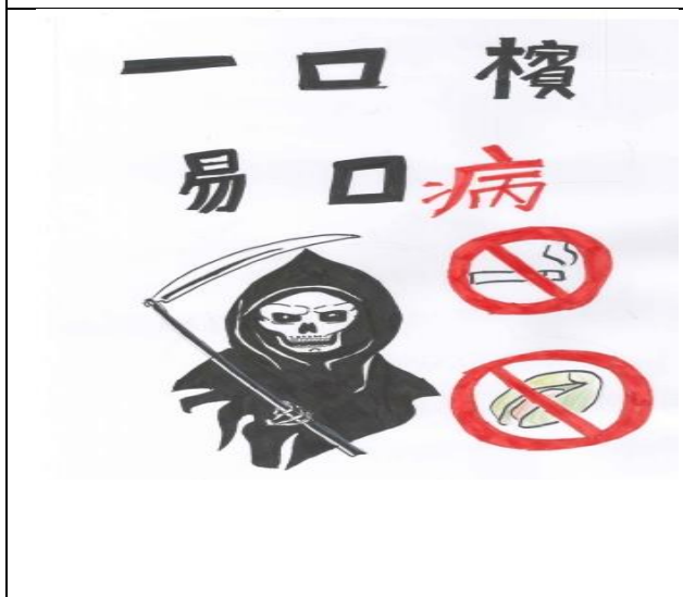
菸癮防制創意標語優秀作品