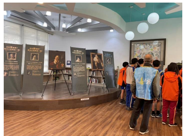
名畫遇見毒品反毒特展—慈濟入校宣導(生教組)