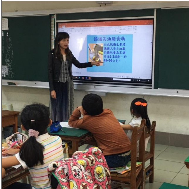
說明：說明高油脂食物的種類和對身體的壞處。