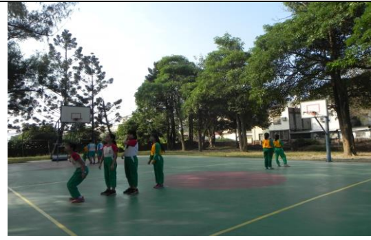
共同討論籃球投法後分組自主練習