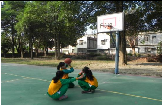
分組討論籃球的握法及投球要領

老師透過分組投籃競賽中，讓學生領略團隊合作與互動共好的精神，也增進了課堂的趣味性及挑戰性，老師並鼓勵同學課餘多練習促進身心健康。