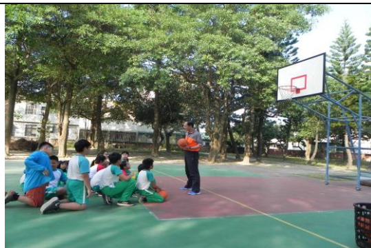
教師最後講解投球要領及技巧重點