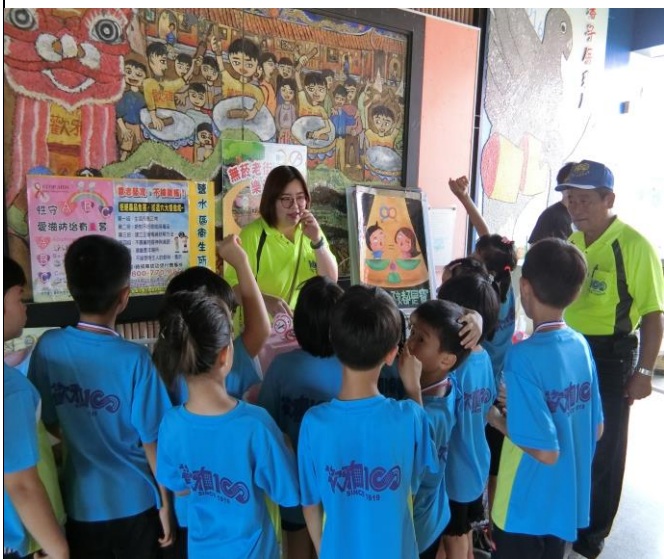
說明：宣導檳榔防制