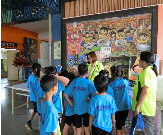
說明：衛生所護理長宣導菸害