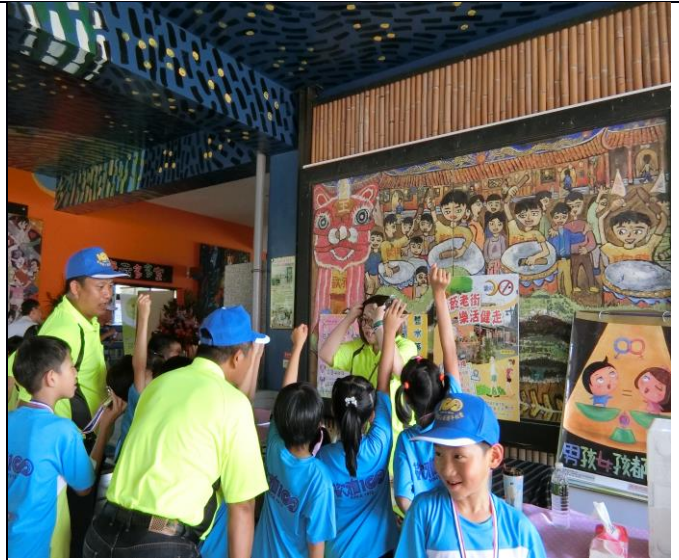
說明：詢問菸害的有哪些