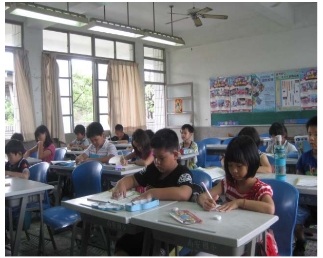
學生於寫作業時能做到執筆及坐姿正確