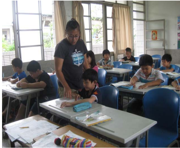
課後班老師能隨時提醒學生端正坐姿