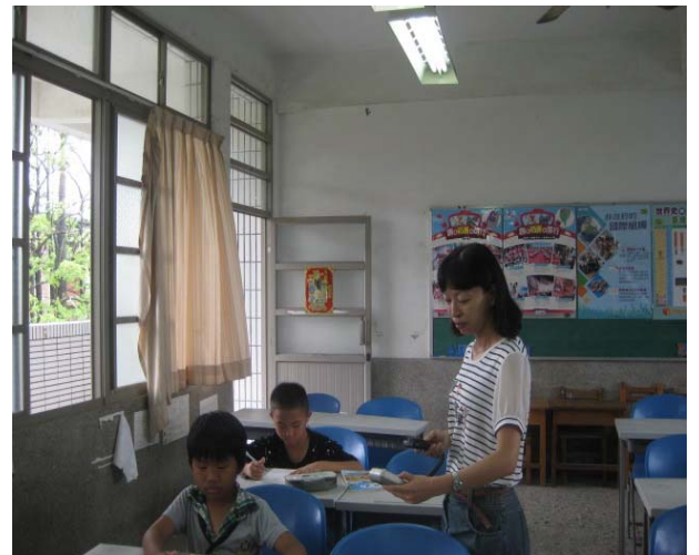
協助校內課後照顧班進行教室測光