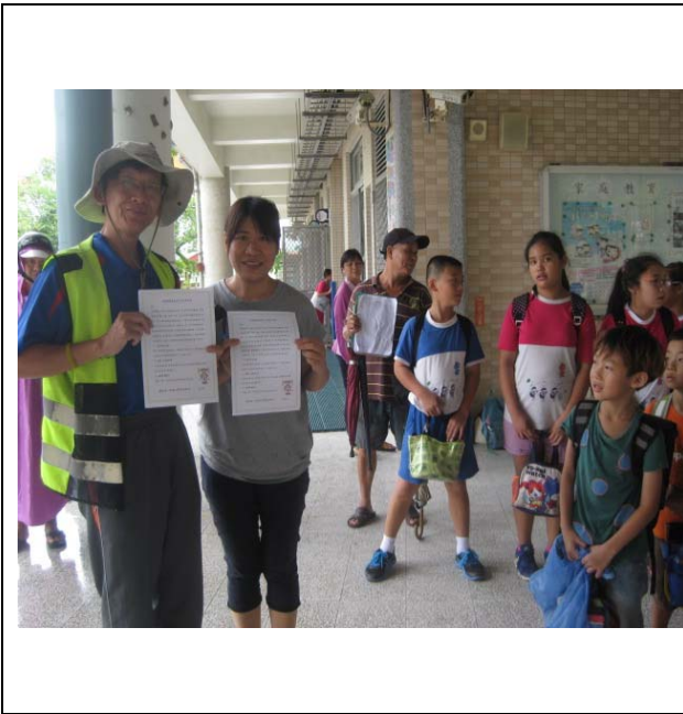
跟課輔機構分發視力保健宣導單