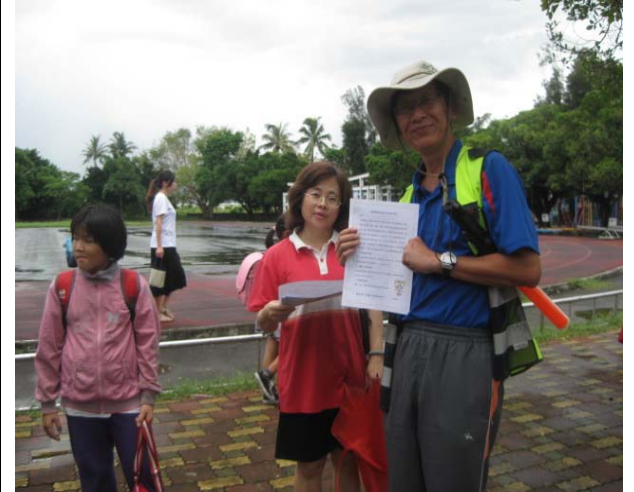
跟課輔機構分發視力保健宣導單